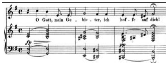
Figure 6 - Robert Schumann Gebet op. 135/5