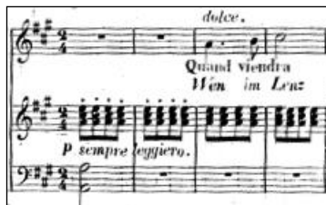
Figure 15 - Hector Berlioz Villanelle op.7/1

Dans Villanelle , le piano, discret, introduit le cycle par deux mesures de croches régulières, définissant d'entrée de jeu les différents rôles joués par le piano et la voix. L'une accompagne, l'autre déclame :