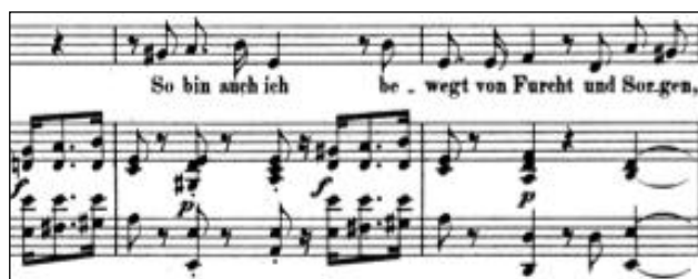
Figure 7 - Robert Schumann An die Königin Elisabeth op.135/3

Axes verticaux et horizontaux sont scellés dans les tonalités munies d'un dièse à la clé (op.135/1, 2, 4 et 5) ou d'absence d'altération (op.135/3). La main droite n'a de cesse de prendre la ligne vocale en filature. Ainsi, l'instrument polyphonique puissant finit par être rassurant, pénétrant l'articulation de chacune des phrases de la Reine. Les cinq pièces sont bâties sur un ambitus vocal relativement restreint. Dans la première pièce mélancolique et douce jouant sur un ressac de majeur-mineur aux couleurs chromatiques, la voix se déploie sur une octave tout comme l'atmosphère sombre de la deuxième pièce. Dans le troisième fragment, Schumann s'aventure sur une onzième alors que dans la quatrième pièce les mailles se resserrent sur une dixième. Cette forme en arche cimenter les fondations de cet édifice. Notons que la première phrase « Je m'en vais loin d'ici » annoncent telle une prémonition la dernière œuvre de ce genre du compositeur. Schumann prend ainsi congé du Lied .