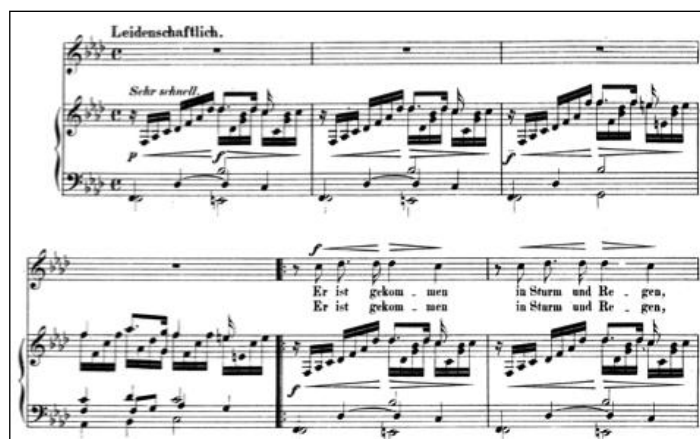
Figure 1 - Clara Schumann Er ist gekommen op.12/1

L'agitation du premier chant trouve un instant de répit dans Liebst du um Schönheit . Ce Lied à l'allure de Choral et de prière présente une stabilité verticale grâce à la symétrie des 4 temps, son tempo lent et son caractère secret. Le thème étiré comme l'horizon se focalise sur un ambitus restreint d'une septième, n'osant pas toucher la justesse de l'octave. Perfection inatteignable.