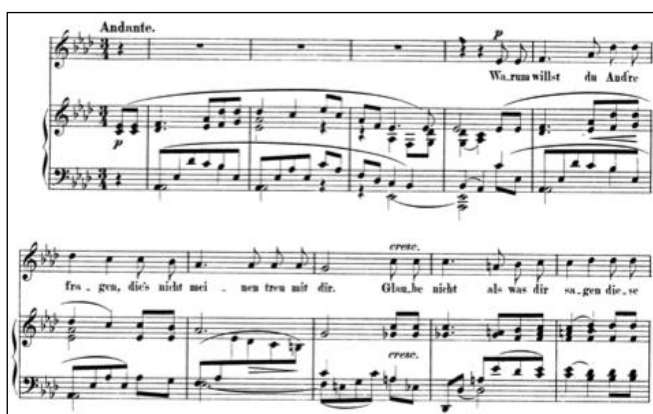
Figure 3 - Clara Schumann Warum willst du and're fragen op.12

Enfin, le troisième Lied interroge l'Amour avec la perfection d'une mesure à trois temps, yeux dans les yeux Warum willst du and're fragen . Le décor d'apparence calme aux nuances douces est parfois perturbé par des soubresauts incarnés par les mouvements disjoints de la voix :