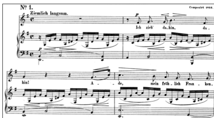
Figure 4 - Robert Schumann Abschied von Frankreich op. 135

La voix féminine semble être un porte parole fidèle pour Robert. En effet, l'op.135 constitue le quatrième cycle de Lieder destiné à la voix féminine. 11 Robert rend ici hommage à Marie Stuart dont le désespoir fractionne l'atmosphère de douleur. Sa recherche de quiétude passe par la prière et s'échafaude en l'espace de cinq poèmes. Ces cinq fragments se fondent littéralement dans la musique de Schumann. Des mouvements cycliques esquissés par le piano supportent la ligne vocale. L'inertie de ce mécanisme est faible, on entre directement dans le cœur de la pensée :