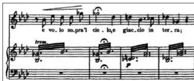
Figure 11 - Franz Liszt Pace non trovo / Pétrarque Sonnet 104 pour voix et piano

Ou alors, contrairement à l'univers intime des Schumann, Liszt enveloppe la ligne vocale d'octaves supérieures sur fond d'arpèges comme par exemple dans le Sonnet 104 :