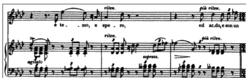
Figure 10 - Franz Liszt Pace non trovo / Pétrarque Sonnet 104 pour voix et piano

Plusieurs phrases au piano ponctuent les vers de Pétrarque. Les deux acteurs du Lied ont leur mot à dire et parlent souvent en s'écoutant, c'est-à-dire l'un après l'autre. Les généreuses sentences pianistiques deviennent cependant plus discrètes en présence de la voix :