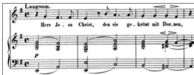
Figure 5 - Robert Schumann Nach der Geburt ihres Sohnes op. 135/2

La ligne musicale dessinée par la main droite suit pas à pas celle de la voix tel un bateau voguant sur la ligne d'horizon. Ce mouvement linéaire est parfois interrompu par une écriture verticale profondément enracinée dans un décor de Choral et particulièrement propice à la déclamation d'une prière (fig. 5 et 6). Les rythmes pointés confiés à la voix imprègnent la mélodie d'un léger mouvement indispensable pour alimenter l'agitation des propos au ton implorateur de la Reine, comme par exemple dans Herr Jesu Christ, den sie gekrönt mit Dornen (fig. 5), dans O Gott, mein Gebieter, ich hoffe auf dich (fig. 6) ou encore dans So bin Auch ich bewegt von Furcht und Sorgen (fig. 7) :