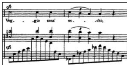
Figure 12 - Franz Liszt Pace non trovo / Pétrarque Sonnet 104 pour voix et piano

Ou alors, contrairement à l'univers intime des Schumann, Liszt enveloppe la ligne vocale d'octaves supérieures sur fond d'arpèges comme par exemple dans le Sonnet 104 :