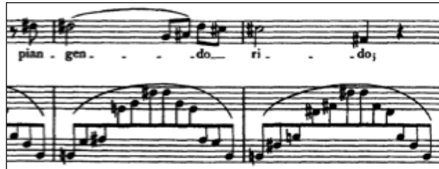
Figure 13 - Franz Liszt Pace non trovo / Pétrarque Sonnet 104 pour voix et piano

Des harmonies complexes décorent les vers chantés de longues dissonances électrisant l'atmosphère : « ma vie n'est et ne sera qu'une longue dissonance sans résolution » écrira Liszt. 13 Certains thèmes aux allures wagnériennes - Liszt voue une admiration sans bornes pour Wagner dont il deviendra le beau-père - explosent de chromatismes comme l'atteste ce passage serti de dièses dans un univers étoilé de quatre bémols à la clé :