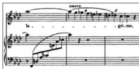
Figure 14 - Franz Liszt Benedetto sia 'l giorno pour voix et piano

Enfin, l'écriture de Liszt interprète les sentiments décrits par Pétrarque au moyen de formules dignes des grands madrigalistes italiens du XVI e siècle. Par exemple, le désespoir évoqué sur le mot lacrima (larmes) dans « Benedetto sia 'l giorno » se traduit par une cascade chromatique. Les larmes, soumises à la force de gravitation, tombent et roulent alors que le piano agit avec une force contraire en opposant à ce mouvement un arpège ascendant :