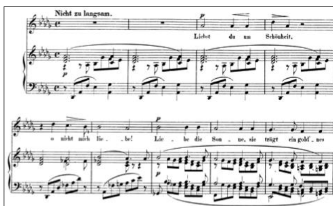
Figure 2 - Clara Schumann Liebst du um Schönheit op.12/2

L'agitation du premier chant trouve un instant de répit dans Liebst du um Schönheit . Ce Lied à l'allure de Choral et de prière présente une stabilité verticale grâce à la symétrie des 4 temps, son tempo lent et son caractère secret. Le thème étiré comme l'horizon se focalise sur un ambitus restreint d'une septième, n'osant pas toucher la justesse de l'octave. Perfection inatteignable.