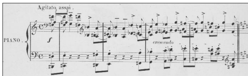
Figure 9 - Franz Liszt Pace non trovo / Pétrarque Sonnet 104 pour piano

Plusieurs phrases au piano ponctuent les vers de Pétrarque. Les deux acteurs du Lied ont leur mot à dire et parlent souvent en s'écoutant, c'est-à-dire l'un après l'autre. Les généreuses sentences pianistiques deviennent cependant plus discrètes en présence de la voix :